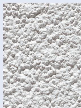
зернистая структура K20 – зерно 2 мм