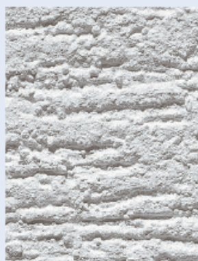
бороздчатая структура R20 – зерно 2 мм