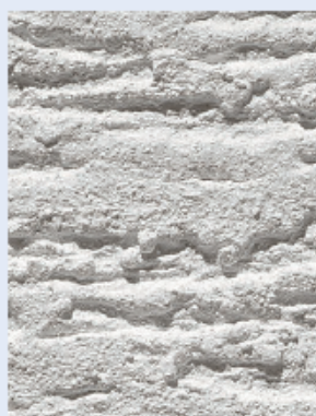
бороздчатая структура R30 – зерно 3 мм