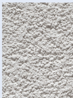
зернистая структура K15 – зерно 1,5 мм