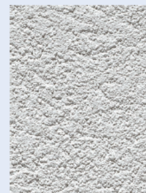
гладкая структура K10 – зерно 1 мм (только для Capatect Fassadenputz)